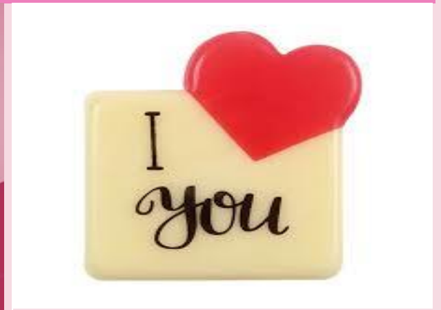
Hoe zeg je "ik hou van jou" in andere talen blz. 14