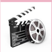
FILMTIP BLZ. 11