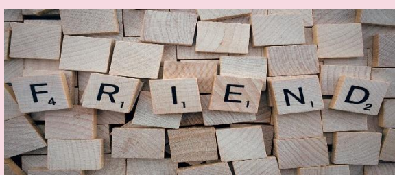
Vriendschapstest Wat voor vriend ben jij? Doe de test. Blz. 4-5