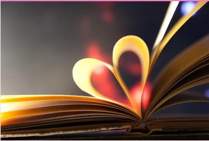
Boekentips blz 2-3