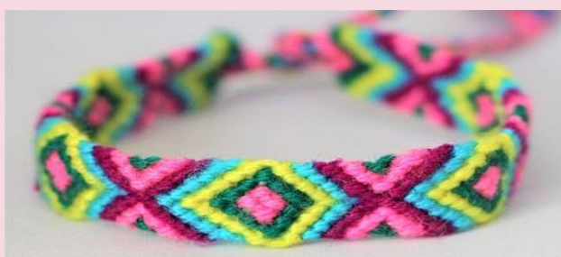
Vriendschapsbandje maken blz. 6