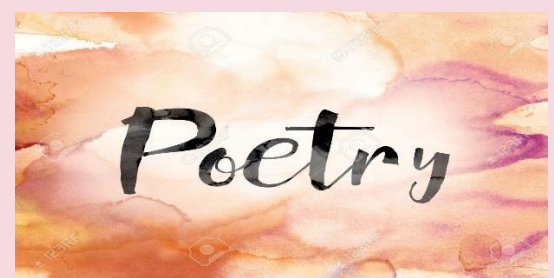
Gedichten blz. 12