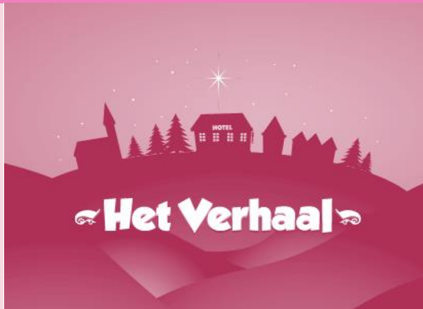
Het verhaal blz. 9-10